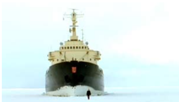
© Guido van der Werve, Nummer Acht : Everything is going to be alright [au Goethe-Institut et au LAIT]