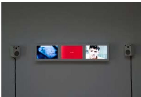
© Grégory Chatonsky, Revolution [à Lieu-Commun]