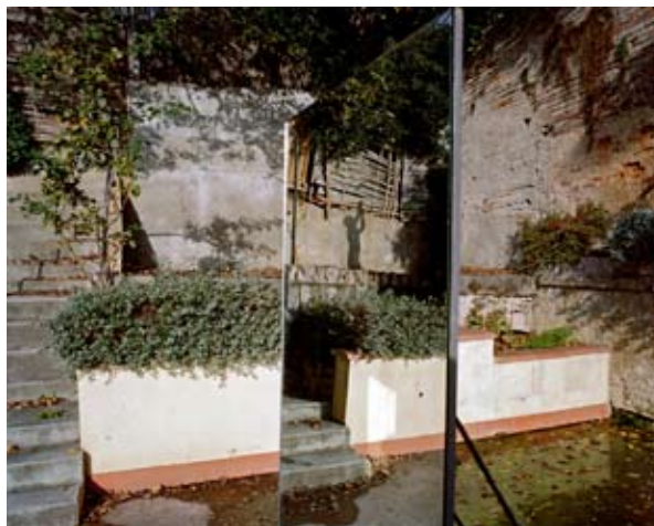
© Beatrix von Conta, Surfaces de contact [à Lecture]